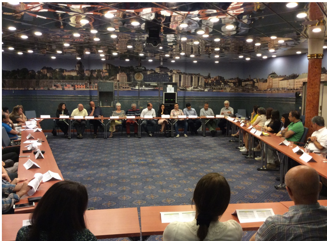
جلسه مجمع عمومی سوتای سوئد در کشتی بیرکا، ژوئن ۲۰۱۵

گردهمائی بعدی در روزهای ۱۲ و ۱۳ ژوئن ۲۰۱۵ با شرکت ۴۳ نفر در سفر خاطره‌انگیزی با کشتی Mariehamn به Birka برگزار شد که در آن اساسنامه سوتای سوئد به تصویب نهائی مجمع عمومی رسید.