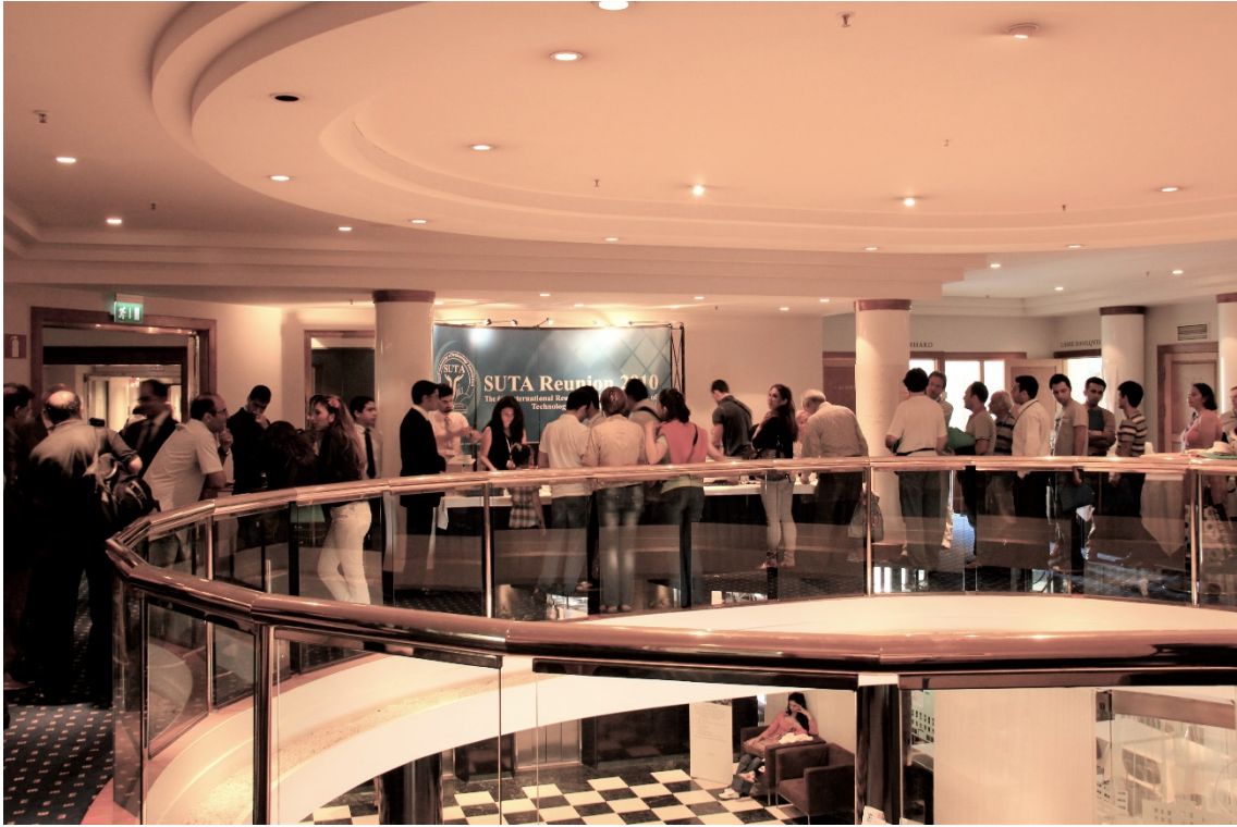
Göteborg، همایش سراسری، ژوئیه ۲۰۱۰