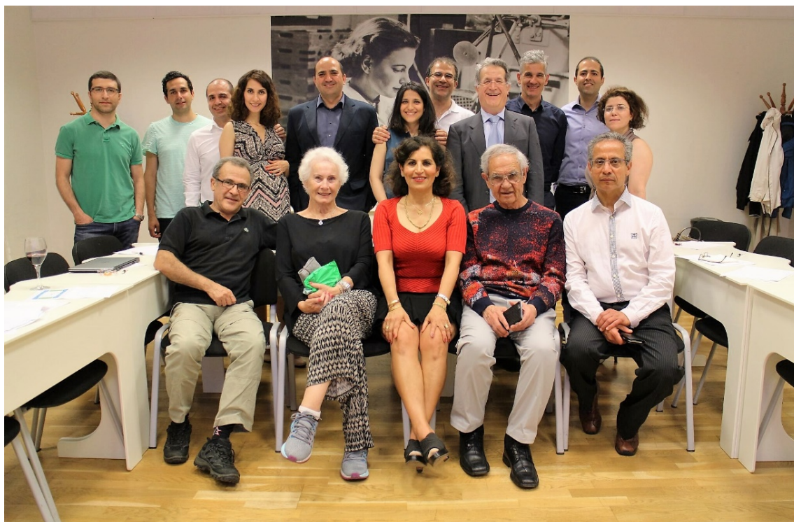
مجمع عمومی در ۱۷ و ۱۸ ژوئن ۲۰۱۶ در Nyköping