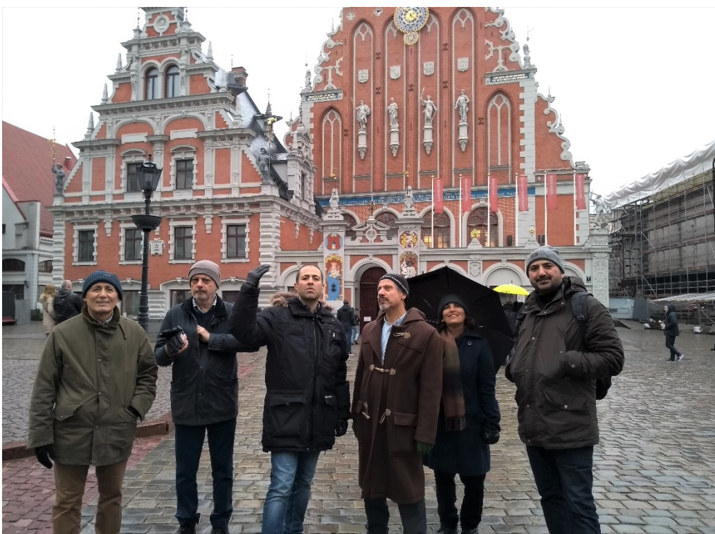
ریگا، ۹ نوامبر ۲۰۱۹