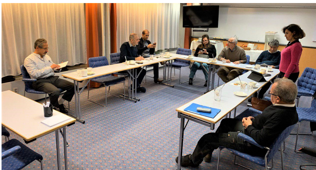
مجمع عمومی فوق العاده در کشتی به سوی ریگا، ۸ نوامبر ۲۰۱۹

توضیح: تا پیش از آن حق عضویت‌ها به حساب سوتای مرکزی واریز می‌شد و سوتای مرکزی موظف بود که نیمی از آن را به سوتای سوئد برگرداند. اما برگشت آن همیشه با اصطکاک فراوان و عدم تعامل سوتای مرکزی همراه بود، به طوری که سال‌هاست که سهم سوتای سوئد به حساب سوئد واریز نشده است. بدین جهت پیشنهاد فوق ارائه شد که به اتفاق آرا تصویب گردید.