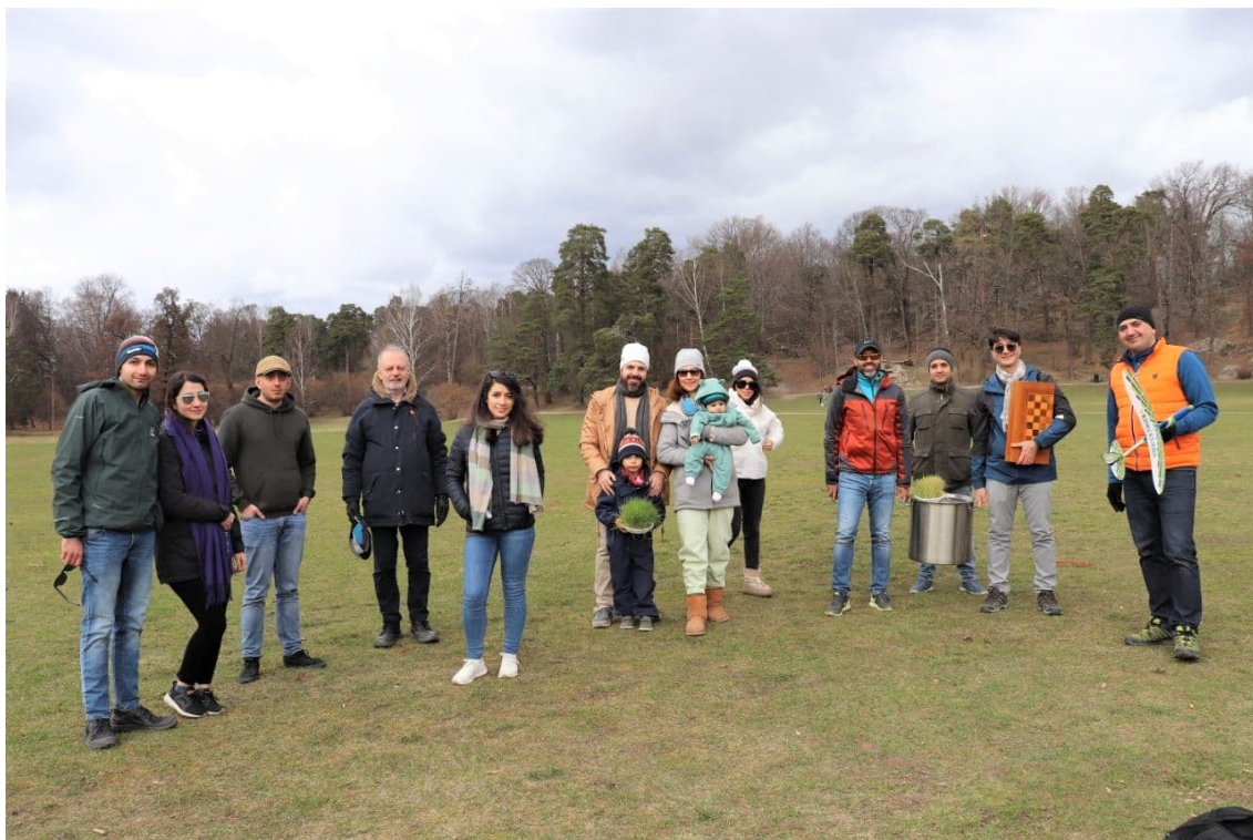
سیزده بدر در هاگپارکن، ۱۲ آوریل ۲۰۲۱

سیزدهم فرورین (۱۲ آوریل) نیز بهانه خوبی برای تجدید دیدارها در فضای آزاد برای اعضای سوتای سوئد در استکهلم شد.