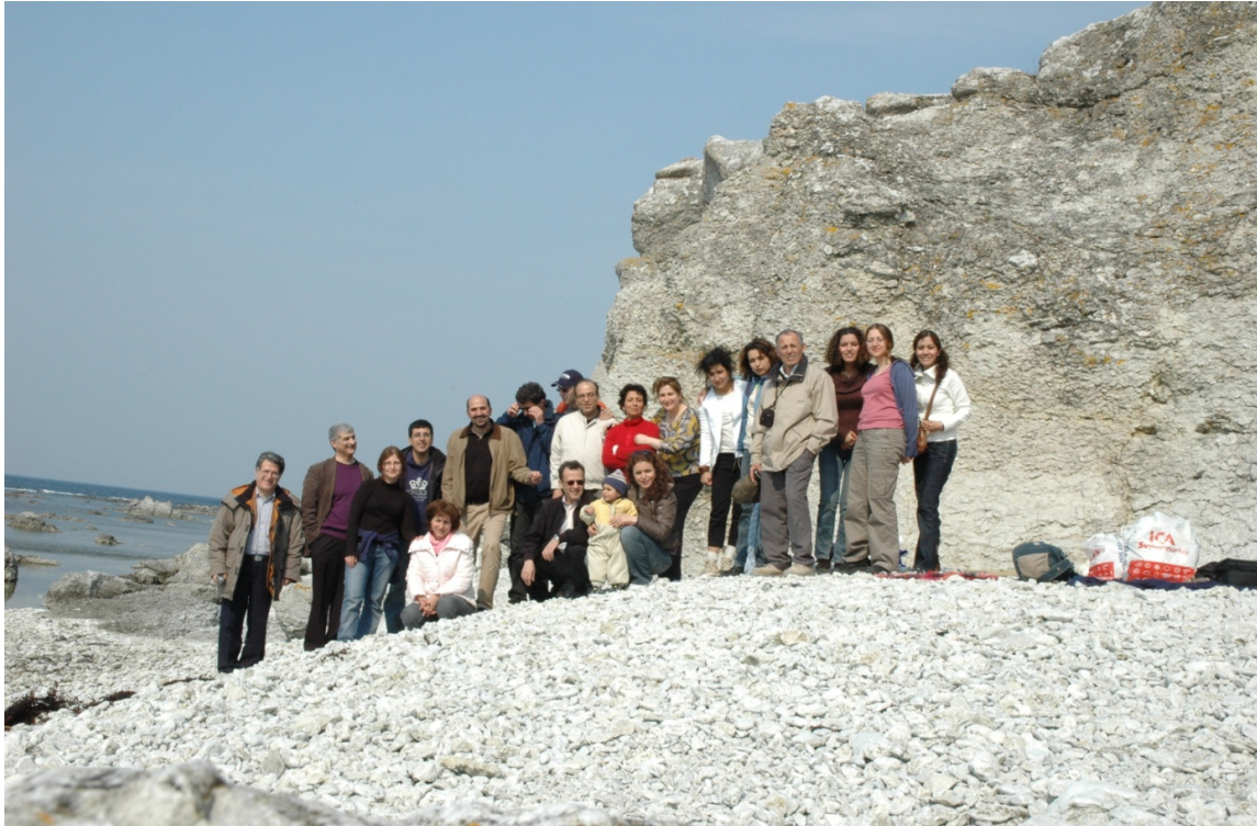
Gotland، آوریل ۲۰۰۶