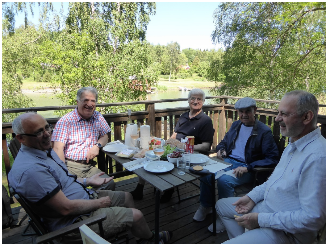
مجمع عمومی سالانه، ۷ و ۸ ژوئن ۲۰۱۸ در Marholmen