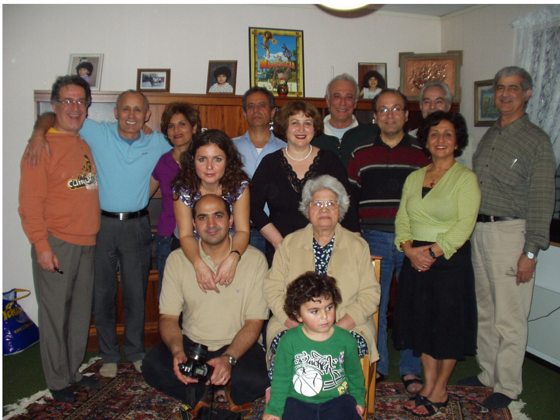
Ludvika سپتامبر ۲۰۰۷