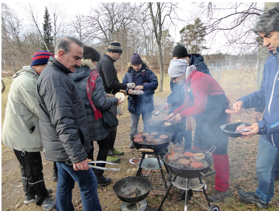
گردهمایی زمستانی، ۱۶ و ۱۷ فوریه ۲۰۱۷ در Marholmen