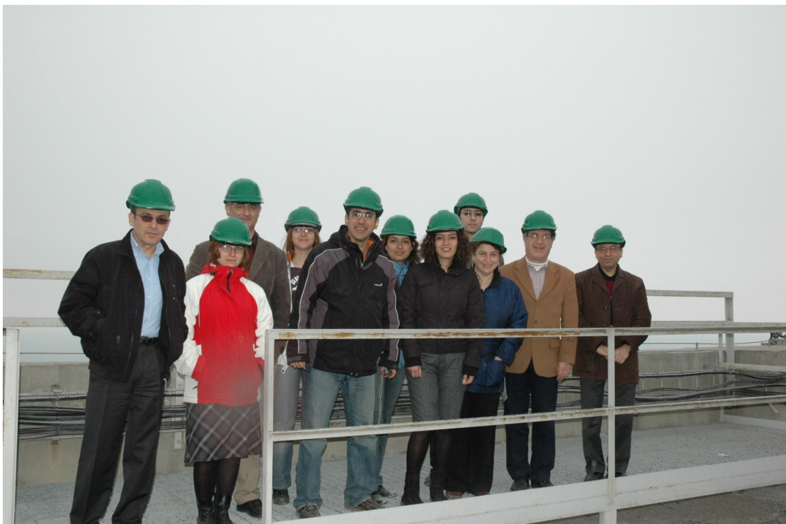
Gotland، آوریل ۲۰۰۶