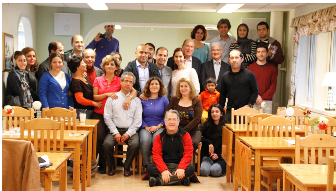
Missmyra، ۱۲ اکتبر ۲۰۱۳

این اساسنامه پس از تصویب در هیئت مدیره در اختیار همه‌ی اعضا قرار گرفت تا در مجمع عمومی پیش رو به تصویب نهائی برسد.