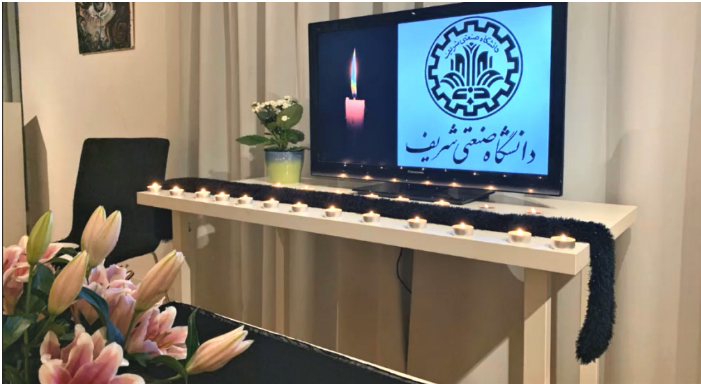
مجلس یادبود کشته‌شدگان سرنگونی هواپیما در ایران. Gröndal استکهلم، دوم فوریه ۲۰۲۰

مجلس یادبود کشته‌شدگان سرنگونی هواپیمای اوکرائینی در ایران، دوم فوریه ۲۰۲۰. در این مورد دو بیانیه نیز منتشر شد.