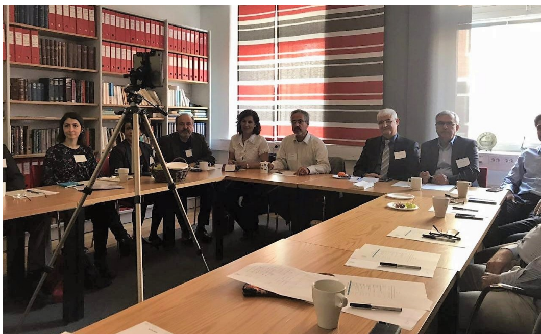
استکهلم، سمینار در KTH، ۲۹ سپتامبر ۲۰۱۸