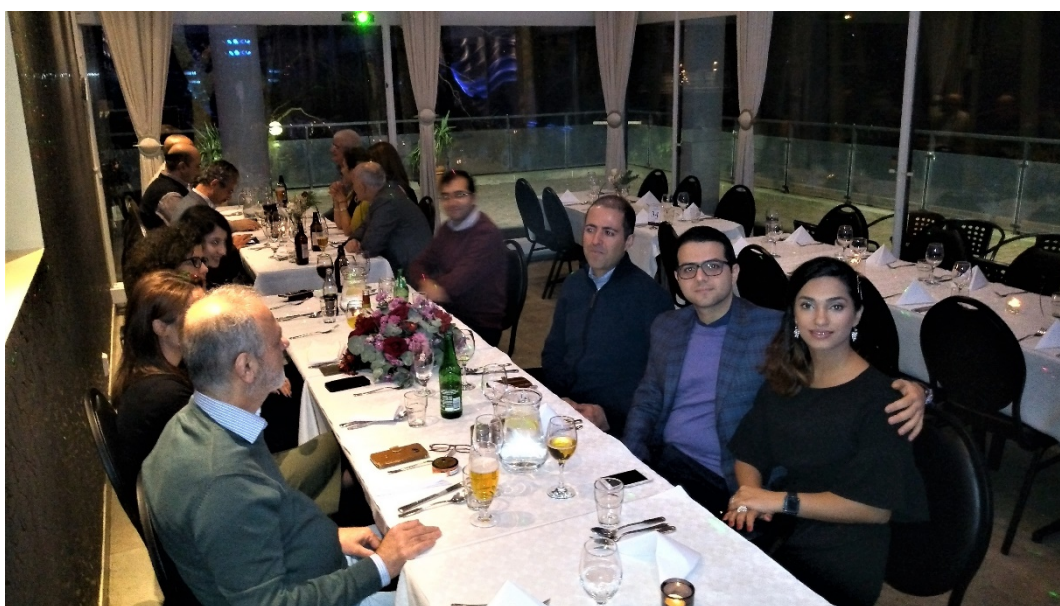
استکهلم، دیدار زمستانی، ۱۲ ژانویه ۲۰۱۹