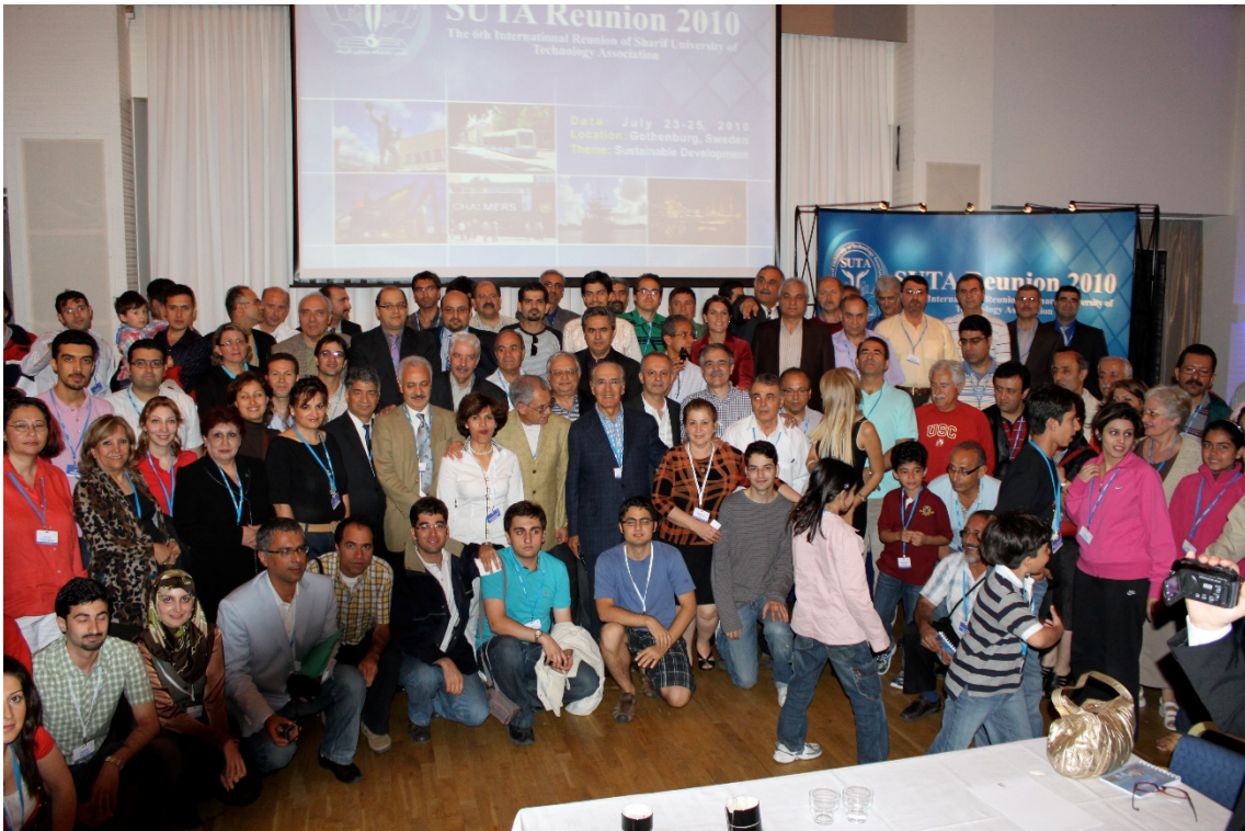
Göteborg، همایش سراسری، ژوئیه ۲۰۱۰