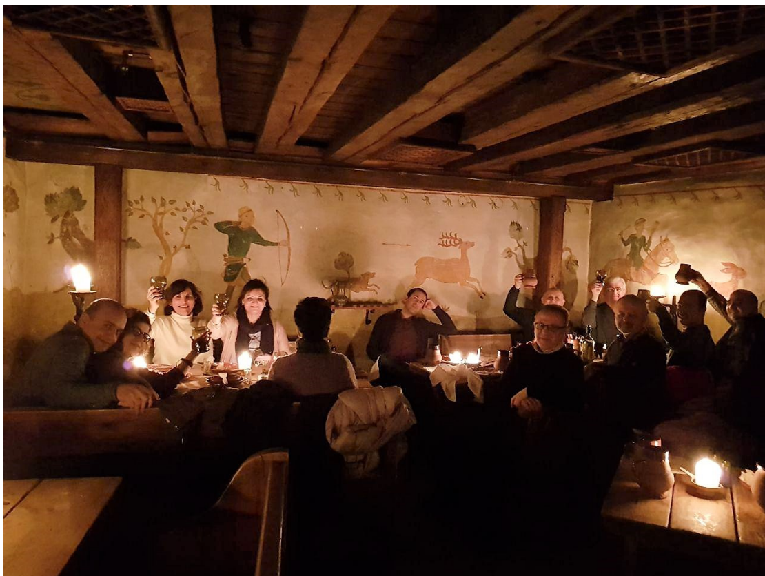
گردهمایی زمستانی، ۱۶ و ۱۷ فوریه ۲۰۱۸ در Tallinn