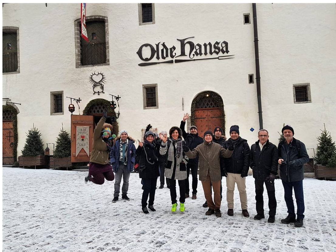
گردهمایی زمستانی، ۱۶ و ۱۷ فوریه ۲۰۱۸ در Tallinn