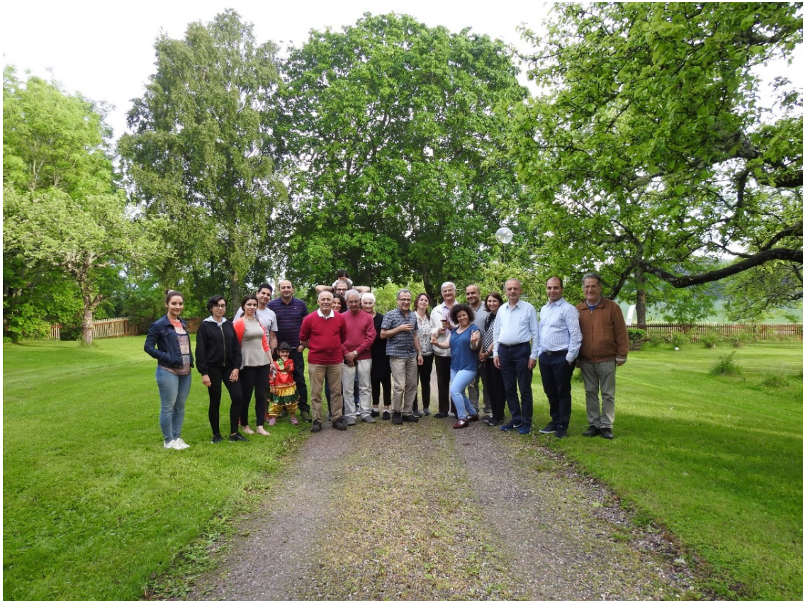
مجمع عمومی سالانه، ۸ و ۹ ژوئن ۲۰۱۷ در Köping