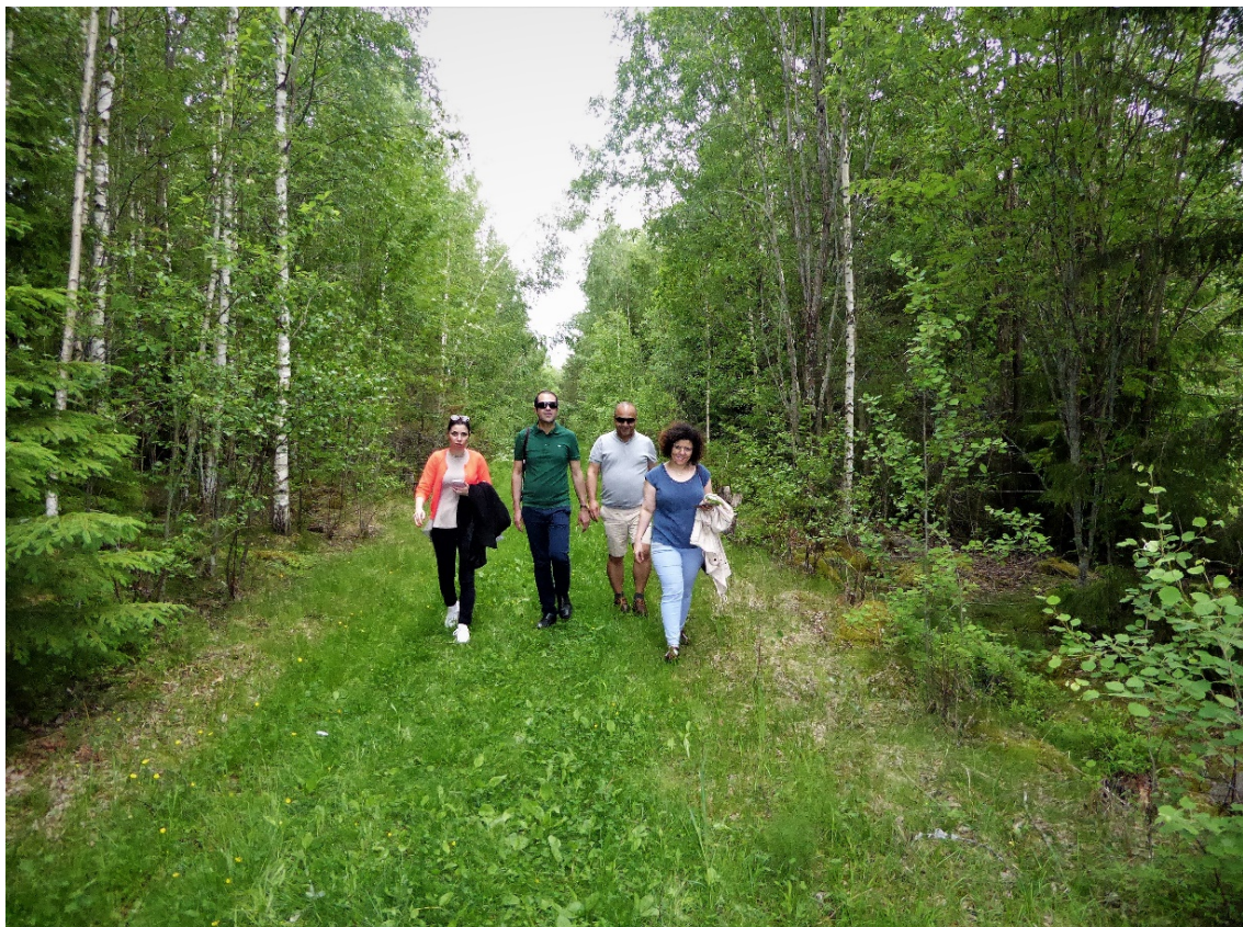
مجمع عمومی سالانه، ۸ و ۹ ژوئن ۲۰۱۷ در Köping