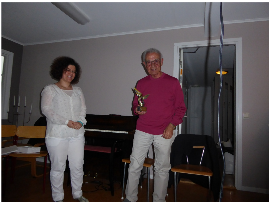
مجمع عمومی سالانه، ۸ و ۹ ژوئن ۲۰۱۷ در Köping