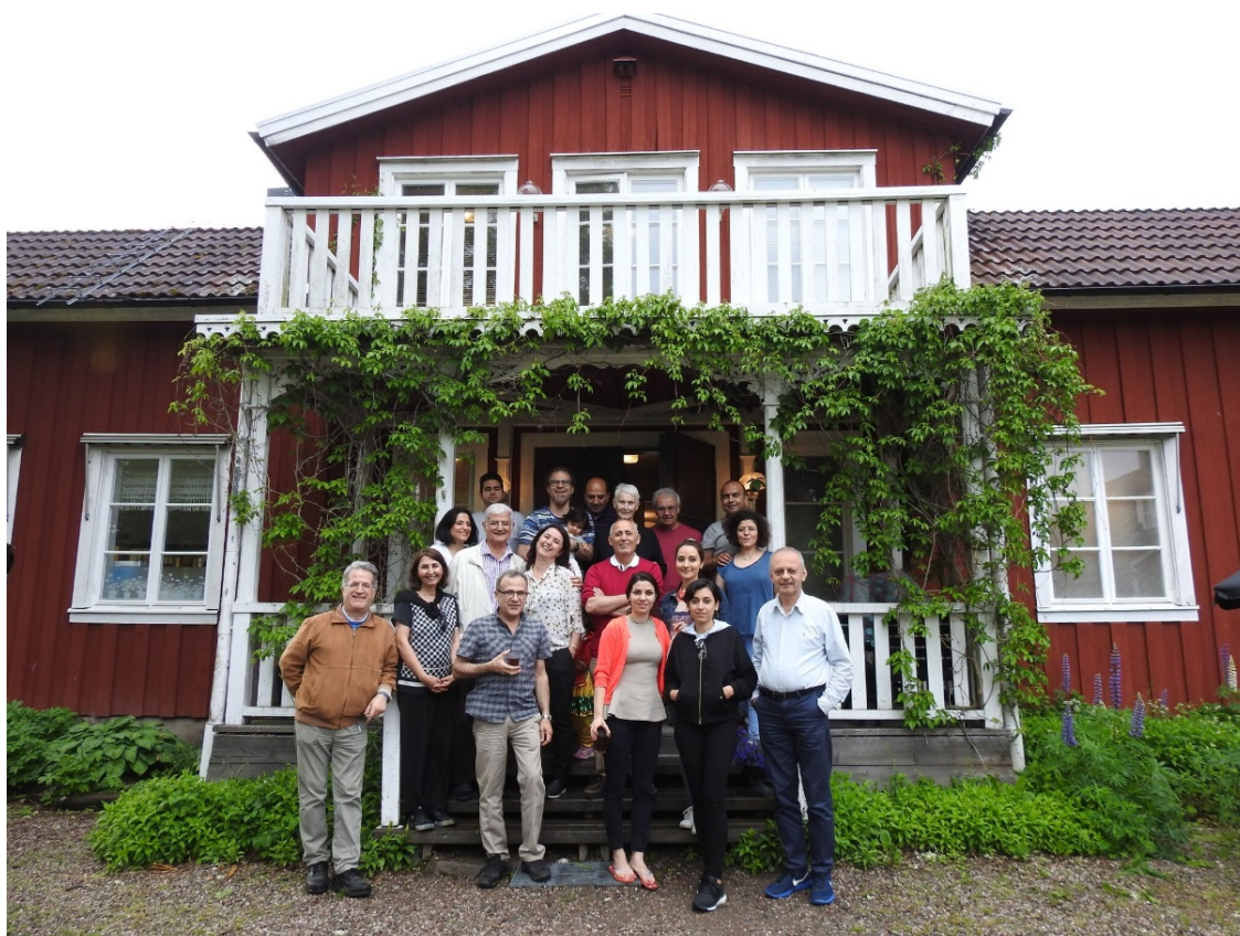
مجمع عمومی سالانه، ۸ و ۹ ژوئن ۲۰۱۷ در Köping