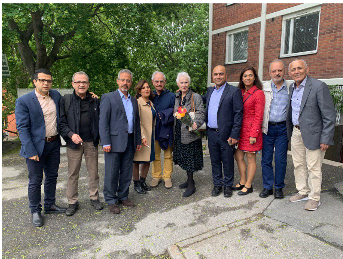
مجمع عمومی سالانه، ۱ ژوئن ۲۰۱۹، استکهلم