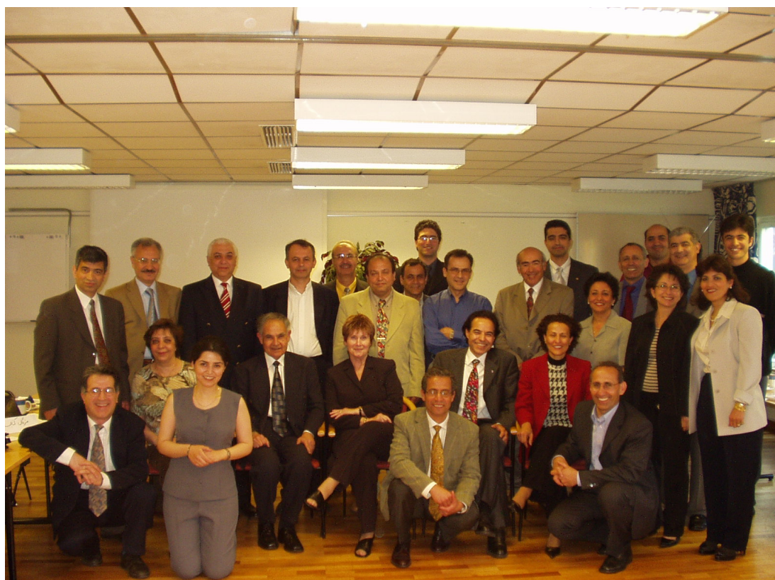
استکهلم، هتل Quality در Skärholmen، ۳۰ مه ۲۰۰۳

نخستین گردهمایی سوتای سوئد در ۲۹ و ۳۰ ماه مه ۲۰۰۳ در استکهلم (Skärholmen) برگزار شد. گزارش آن در خبرنامه‌ی شماره ۶ (ژوئن ۲۰۰۳) درج شده است.