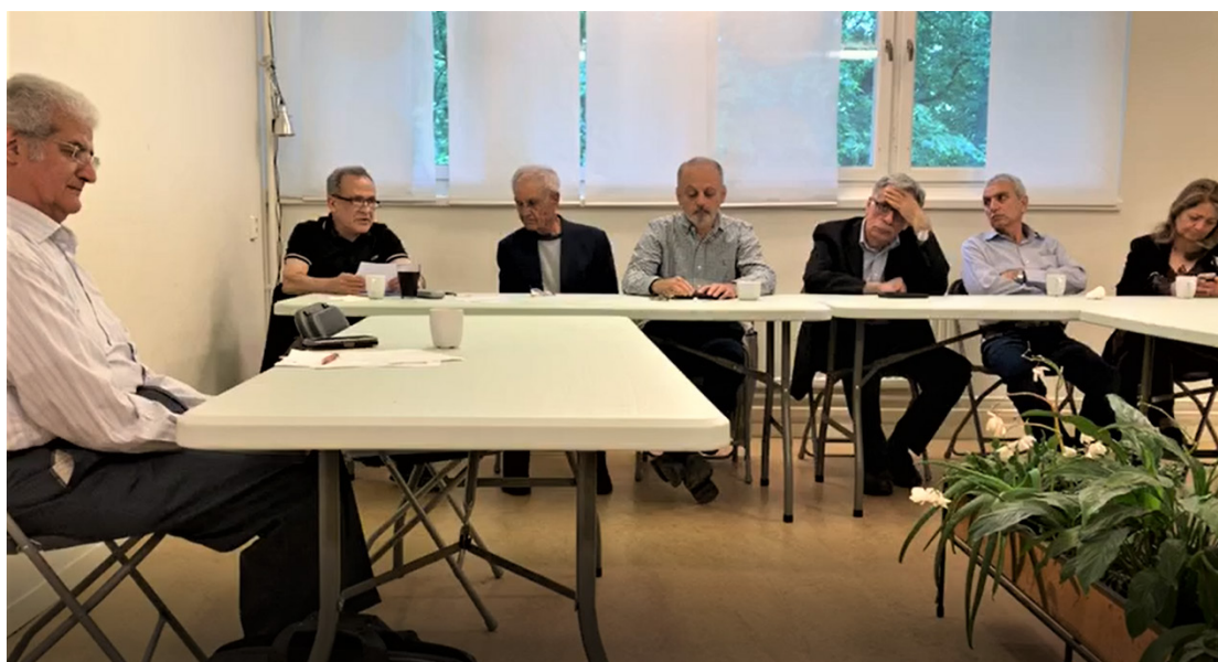
مجمع عمومی سالانه، ۱ ژوئن ۲۰۱۹، استکهلم