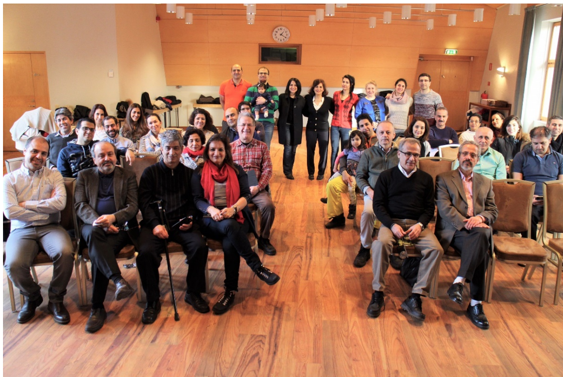
گردهمایی زمستانی ۱۶ و ۱۷ فوریه ۲۰۱۷ در Marholmen