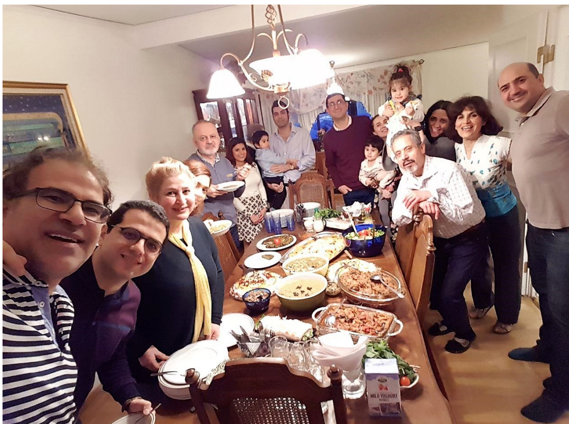
گردهمایی و ضیافت، ۱۰ و ۱۱ مارچ ۲۰۱۸ در Sandviken