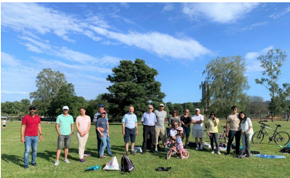
گردهمایی در فضای باز در هاگاپارکن، استکهلم، دوم آگوست ۲۰۲۰

همچنین در تاریخ دوم آگوست ۲۰۲۰، یک گرد هم آتی در فضای آزاد در هاگاپارکن بمرحله اجرا در آمد.